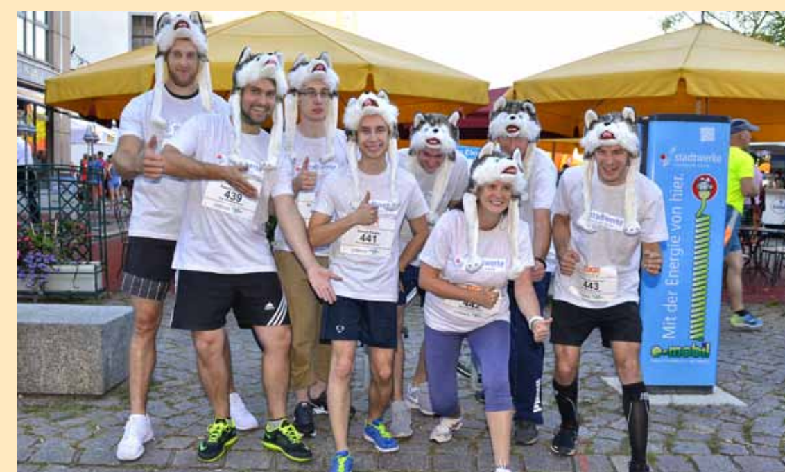
3. DAK Firmenlauf