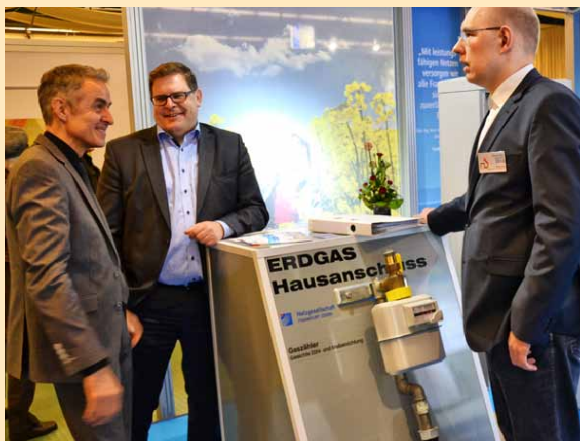
Baumesse für das Oderland

Mit einem E-Golf sind seit kurzem die Kollegen der Netzgesellschaft im Stadtgebiet unterwegs – leise, ohne lästige Abgase und damit zeitgemäß.