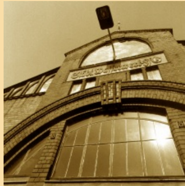
10-1992 Gründung der FWA Frankfurter Wasser- und Abwassergesellschaft mbH (68,5 % im Eigentum der Stadtwerke)

Vereinbarung zur Beilegung des Streits vor dem Bundesverfassungsgericht über die Struktur der Stromversorgung in den neuen Bundesländern