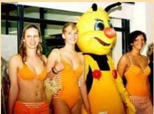
2. local* card-Aktionstag