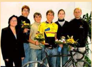
Erfolg braucht starke Partner