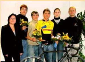
Erfolg braucht starke Partner

Wie in jedem Jahr konnten die Mitarbeiterinnen und Mitarbeiter der Stadtwerke, ihre Angehörigen und Gäste sich beim traditionellen Sportfest in den verschiedensten Sportdisziplinen messen.