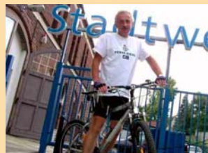
2. Frankfurter Power Biking

Die Stadtwerke waren auf der Messe „Oderland 2005“ mit einem Ausstellungs- und Beratungsstand vertreten. Das 2. Frankfurter Power Biking war eine gelungene Veranstaltung, die mit einem neuen Teilnehmerrekord von 250 Startern sportliche Höchstleistungen von Profi- und Breitensportlern hervorbrachte und bei der auch der Spaß an der Bewältigung der Strecke nicht zu kurz kam.