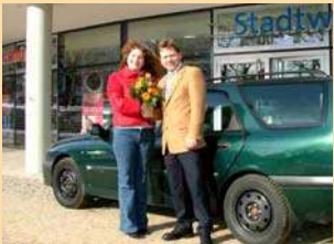
100. Erdgasfahrzeug in Frankfurt (Oder)

Im Sport wird erlebbar, was im Leben gilt: Anstrengungen lohnen sich, konsequente Vorbereitung, energisches Training und voller Einsatz gehen dem Erfolg immer voran. Sponsoring ist ein fester Bestandteil der Unternehmenskommunikation. Unter dem Motto „Erfolg braucht starke Partner“ unterstützen die Stadtwerke viele Frankfurter Sportvereine und tragen so dazu bei, den Ruf der Oderstadt als Brandenburger Sportstadt zu stärken.