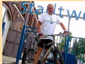
2. Frankfurter Power Biking