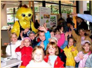
Tag der Umwelt

Im Sport wird erlebbar, was im Leben gilt: Anstrengungen lohnen sich, konsequente Vorbereitung, energisches Training und voller Einsatz gehen dem Erfolg immer voran. Sponsoring ist ein fester Bestandteil der Unternehmenskommunikation. Unter dem Motto „Erfolg braucht starke Partner“ unterstützen die Stadtwerke viele Frankfurter Sportvereine und tragen so dazu bei, den Ruf der Oderstadt als Brandenburger Sportstadt zu stärken.