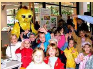
Tag der Umwelt