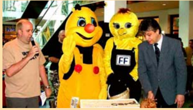
2. local* card-Aktionstag