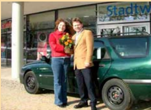
100. Erdgasfahrzeug in Frankfurt (Oder)

Um den jungen Talenten in den östlichen Regionen des Landes Brandenburg einen guten Start und optimale Wettbewerbsbedingungen zu ermöglichen, haben sich die Stadtwerke, gemeinsam mit ihren Gesellschaftern, der E.ON edis Aktiengesellschaft und der EWE Aktiengesellschaft, auch in der 40. Wettbewerbsrunde 2005 engagiert. Die guten Erfahrungen bei der erfolgreichen Vorbereitung und Durchführung der Wettbewerbe in letzten Jahren haben gezeigt, dass diese Kooperation der richtigen Weg ist. Unter der bekannten Adresse www.stadtwerke-ifo.de präsentieren sich die Stadtwerke Frankfurt (Oder) seit Beginn des Jahres mit einem vollständig überarbeiteten Internet-auftritt im weltweiten Netz.