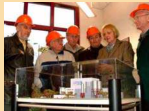
300. Besuchergruppe im HKW