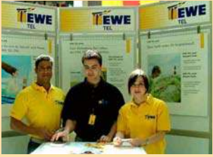
Vertriebspartner EWE TEL