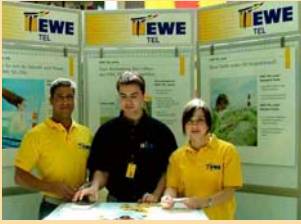
Vertriebspartner EWE TEL