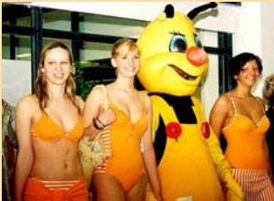
2. local* card-Aktionstag

Auf spannende und interessante Tage konnten die Teilnehmerinnen und Teilnehmer des Wettbewerbes „Jugend forscht – Schüler experimentieren“ im Ramada Treff-Hotel zurückblicken.