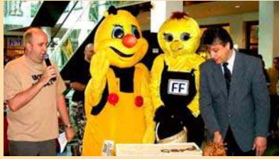
2. local* card-Aktionstag