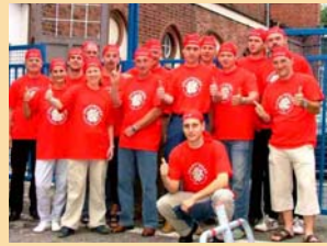
2. E.ON edis-Cup im Drachenbootrennen