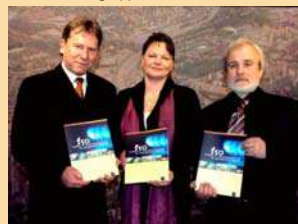
150 Jahre Gasversorgung in Frankfurt (Oder)