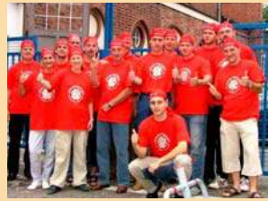
2. E.ON edis-Cup im Drachenbootrennen