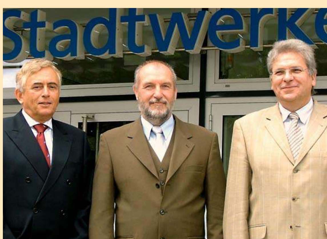
Die neue Geschäftsführung