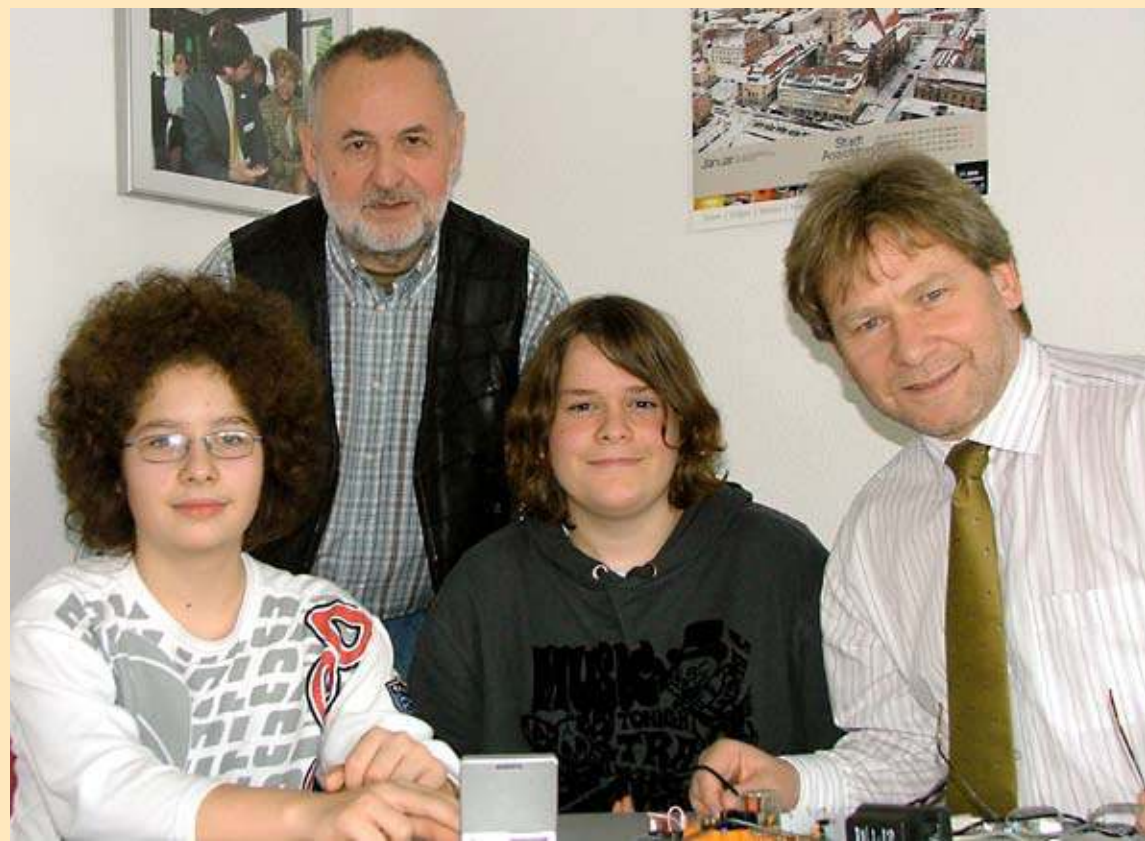
„Jugend forscht 2007“