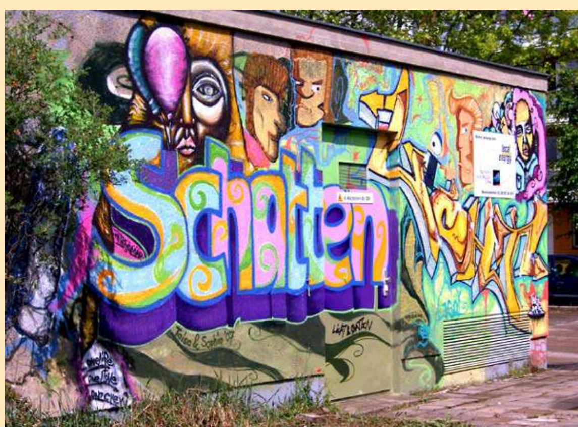
„Graffiti im Projektunterricht“

Zum zweiten Mal haben die Stadtwerke zum Tag der offenen Tür im Heizkraftwerk eingeladen. Zahlreiche interessierte Besucher erlebten beim Rundgang durch die Anlage die Technik, die aus Braunkohlenstaub und Erdgas schließlich Strom und Wärme entstehen lässt und lernten die Stadtwerker kennen, die die unzähligen Maschinen, Rohre und Leitungen beherrschen und ständig alles im Blick haben. Anlässlich der Messe BAUEN + Energie zeigten die Stadtwerke, wie im Haushalt Energie effizient genutzt, Energieeinsparpotenziale ausgeschöpft und unnötiger Stromverbrauch vermieden werden kann.