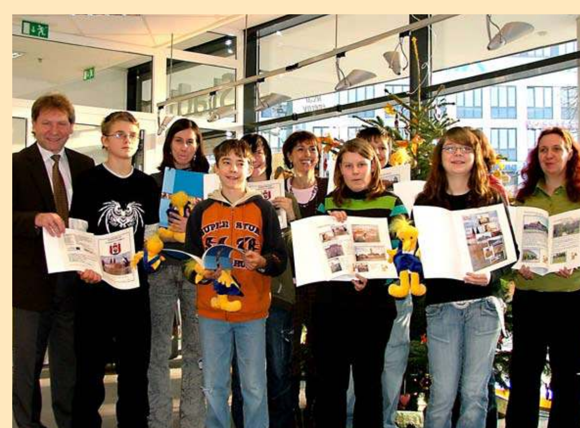
Ein Stadtführer von Kindern für Kinder

Mit viel Fleiß und Engagement haben Schüler und Lehrer der Lessingschule in den letzten Monaten einen Stadtführer von Kindern für Kinder erarbeitet. Die Stadtwerke Frankfurt (Oder) waren von diesem Projekt begeistert und haben den 58-seitigen kurzweiligen Stadtführer in einer ersten Auflage von 50 Stück vervielfältigt. Mit einem Fest für die fleißigen Stadtwerker ging ein ereignisreiches und aufregendes Jahr zu Ende.