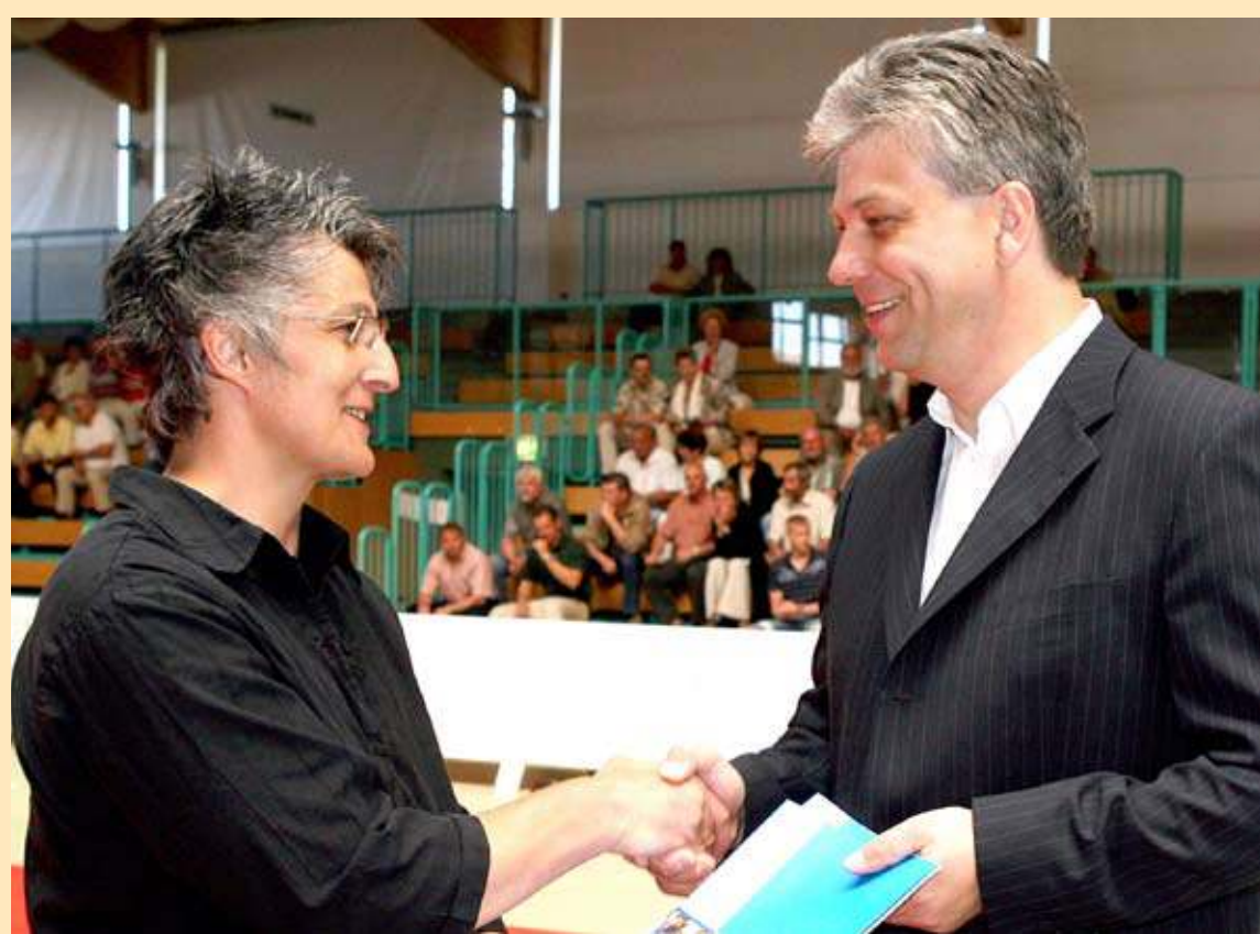
Überreichung der Sponsorenverträge

Ohne Sponsoring gäbe es die Sportstadt Frankfurt (Oder) wohl nicht. Mit ihrer Unterstützung für Frankfurter Vereine übernehmen die Stadtwerke Frankfurt (Oder) gesellschaftliche Verantwortung in der Region.