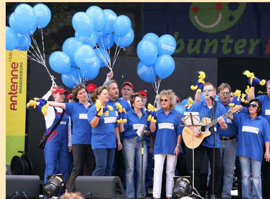
„Bunter Hering 2007“

Neben der Bereitstellung der benötigten Energie für den „Bunten Hering 2007“ beteiligten sich die Stadtwerke an der Gestaltung eines attraktiven Bühnenprogramms. Einer der Fest-Höhepunkte war das 3. Oderschwimmen um den Pokal der Stadtwerke. Der Pokal wurde in diesem Jahr zum zweiten Mal an den Sieger vergeben.