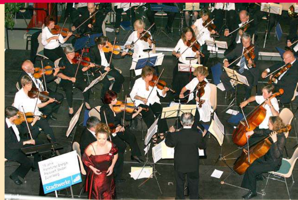
Sommerkonzert im Heizkraftwerk