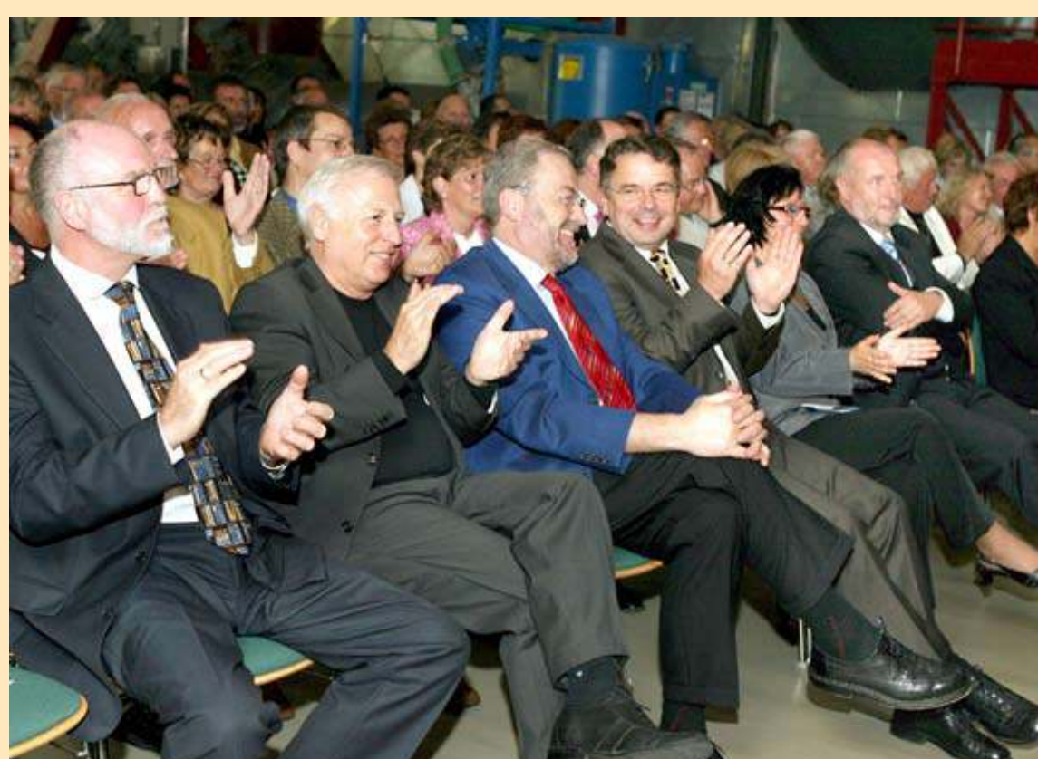
Sommerkonzert im Heizkraftwerk

Öffentliche Fassaden sind oft Opfer von schlimmen und wilden Schmierereien. Daher entschlossen sich Polizei, Jugendamt und Schulamt der Stadt Frankfurt (Oder) einen ganz neuen Weg zu gehen und erarbeiteten gemeinsam eine Konzeption für „Graffiti im Projektunterricht“. Die Stadtwerke unterstützen dieses Projekt.