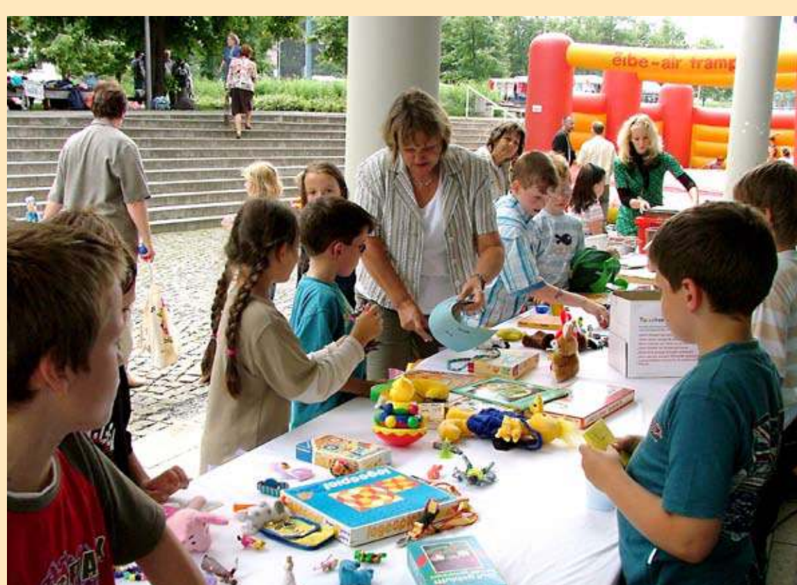
Internationaler Tag der Umwelt

Ganz im Zeichen des 15. Stadtwerke-Geburtstages stand das Sommerkonzert im Heizkraftwerk, zu dem zahlreiche Gäste aus Wirtschaft und Politik begrüßt wurden. Zum Internationalen Tag der Umwelt am 5. Juni luden die Stadtwerke alle Frankfurter Kinder zu Spiel und Spaß rund um das Thema Umweltschutz ein.