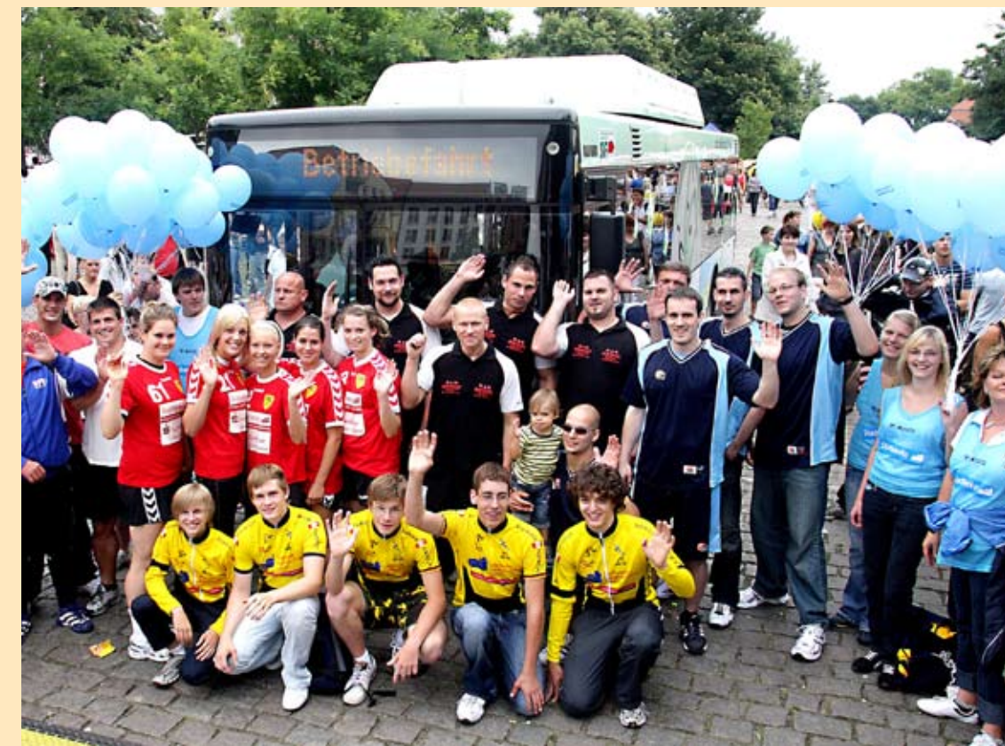
„Bunter Hering 2008“

Im Foyer der Frankfurter Brandenburg-Halle herrschte ein unüberhörbares fröhliches Gewusel, als sich rund 250 Sportlerinnen und Sportler der von den Stadtwerken unterstützten Vereine zum gemeinsamen Fototermin trafen.