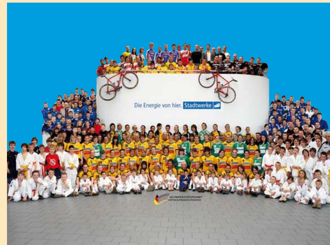
Von den Stadtwerken unterstützte Sportvereine