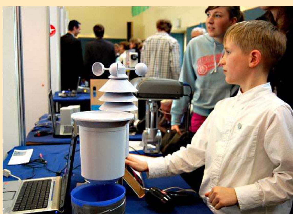
„Jugend forscht 2008“

In der Woche vom 19. bis 23. Mai 2008 fand in Brandenburg die 2. Erdgas-Rallye statt. Gesucht wurde die Fahrerin bzw. der Fahrer, der auf einer vorgegebenen Route den niedrigsten Kraftstoffverbrauch mit einem Erdgasfahrzeug erreichte. Am 23.5.08 war Frankfurt (Oder) Etappenziel. Aus diesem Anlass luden die Stadtwerke zu einem Erdgasauto-Treff an der Frankfurter Erdgastankstelle ein.