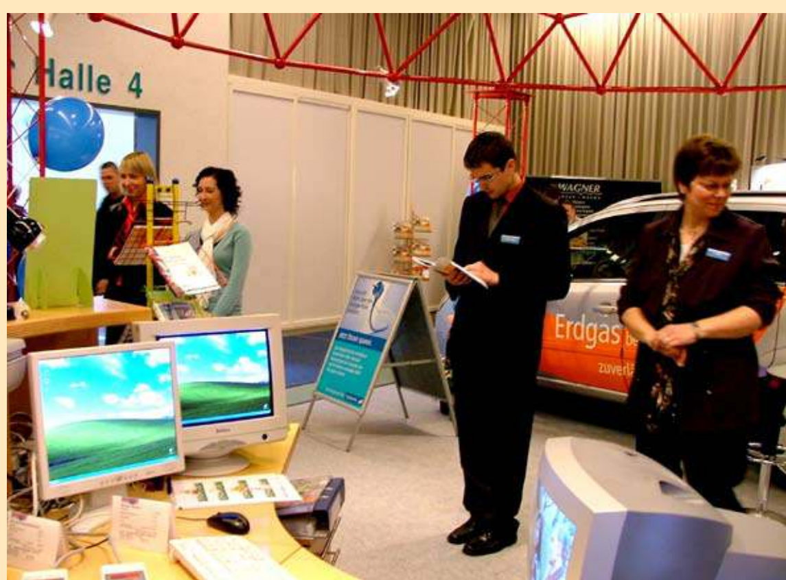
Messe BAUEN+ENERGIE 2008

Mit „Die Energie von hier“ präsentierten sich die Stadtwerke auf der Messe BAUEN+ENERGIE 2008. Dabei standen Energieeffizienz im Heimbüro und Umweltentlastung durch Fahrspaß mit Erdgas im Mittelpunkt des Informationsangebots.