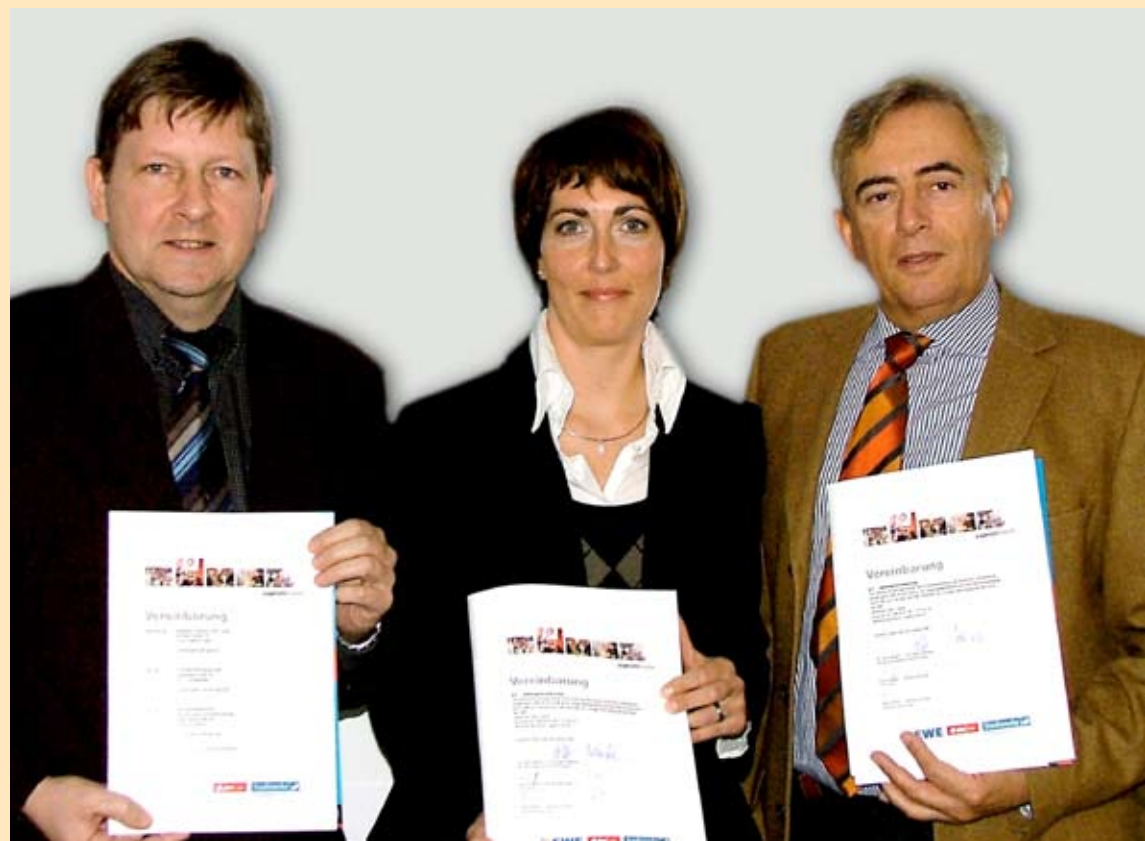
Patenschaften für „Jugend forscht“

Der elektrische Strom hat unser Leben verändert – und das hier in Frankfurt (Oder) nun schon vor genau 110 Jahren. Er ist zu einer alltäglichen Selbstverständlichkeit geworden, ein Universaltalent, das in allen Lebensbereichen anzutreffen ist. Strom spendet Licht, setzt Maschinen und Motore in Bewegung, übermittelt Informationen. Strom ist Voraussetzung für den technischen Fortschritt und in unserer Gesellschaft nicht mehr wegzudenken und seit jeher auch untrennbar mit der Frankfurter Straßenbahn verbunden, die Bürger und Gäste zu Freunden, zur Arbeit und wichtigen Plätzen in der Stadt bringt.