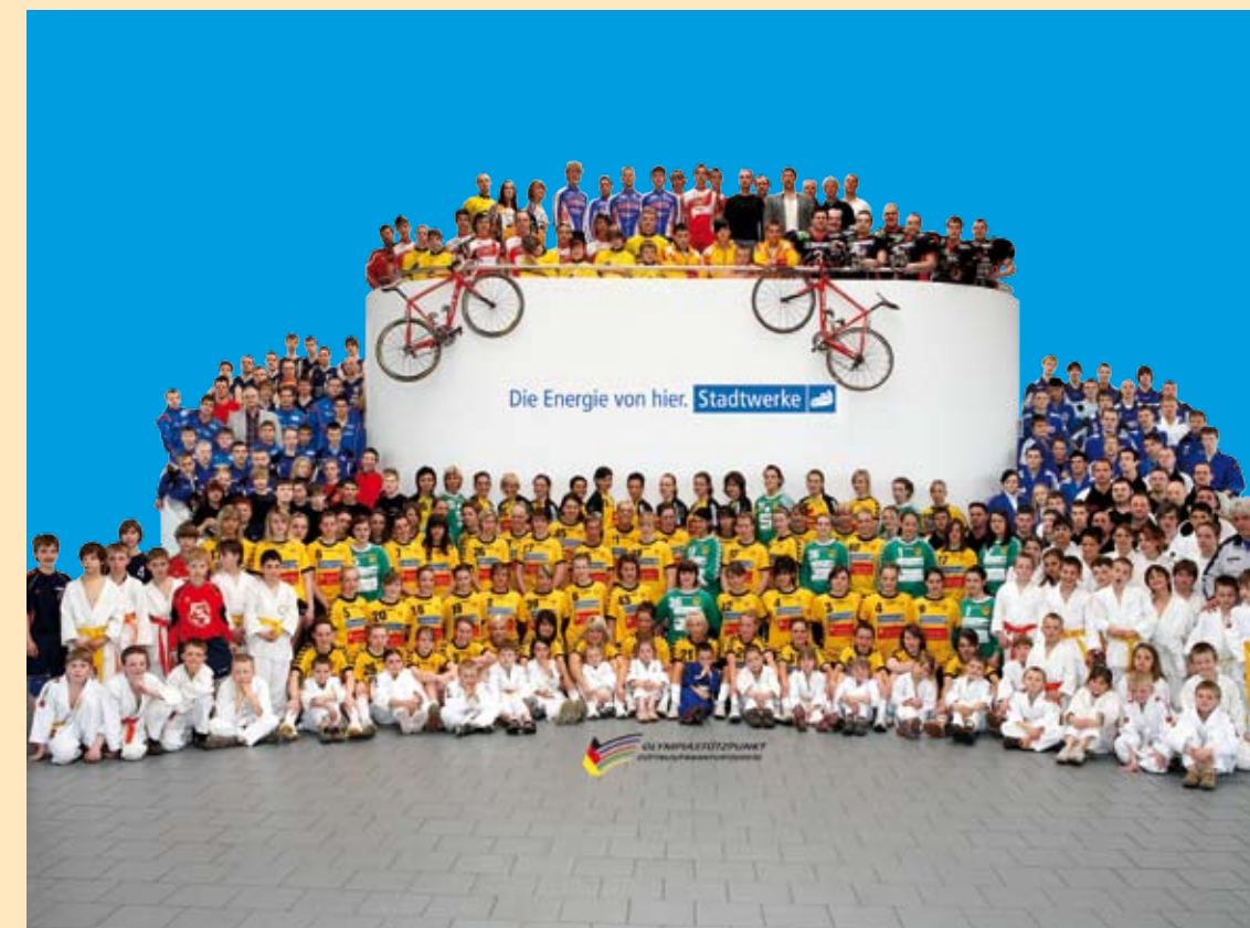
Von den Stadtwerken unterstützte Sportvereine