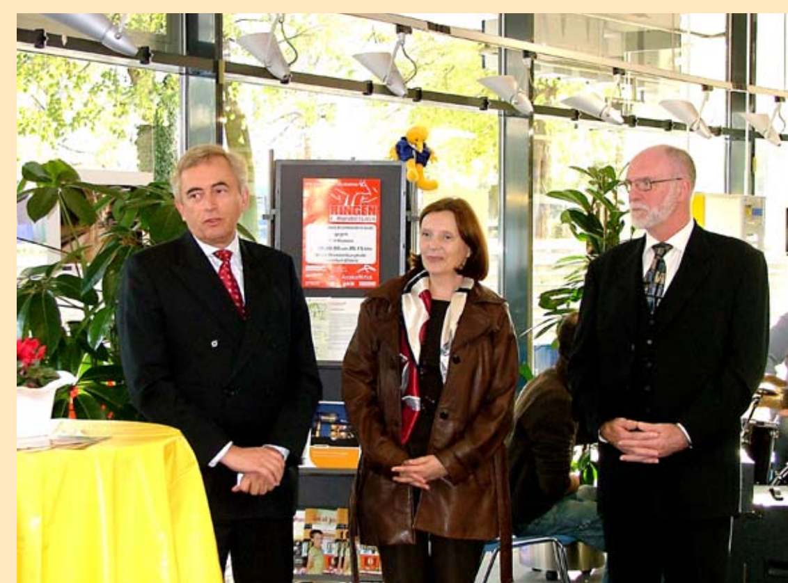
„Lange Nacht der Wirtschaft“

Seit 10 Jahren werden im Rahmen der Aktion „Die umweltfreundliche Schulmappe“ der Abfallberatung der Stadt und der Stadtwerke an alle Frankfurter ABC-Schützen zum Schulanfang Brotdosen und Stundenpläne mit Tipps für eine umweltfreundliche Schulmappe verteilt. Mit dieser Aktion wird den Kindern direkt zu Beginn des neuen Lebensabschnitts verdeutlicht, wie wichtig die Vermeidung von Abfall ist.