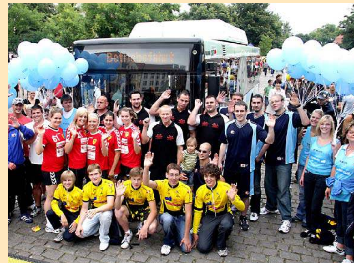
„Bunter Hering 2008“

Im Foyer der Frankfurter Brandenburg-Halle herrschte ein unüberhörbares fröhliches Gewusel, als sich rund 250 Sportlerinnen und Sportler der von den Stadtwerken unterstützten Vereine zum gemeinsamen Fototermin trafen.