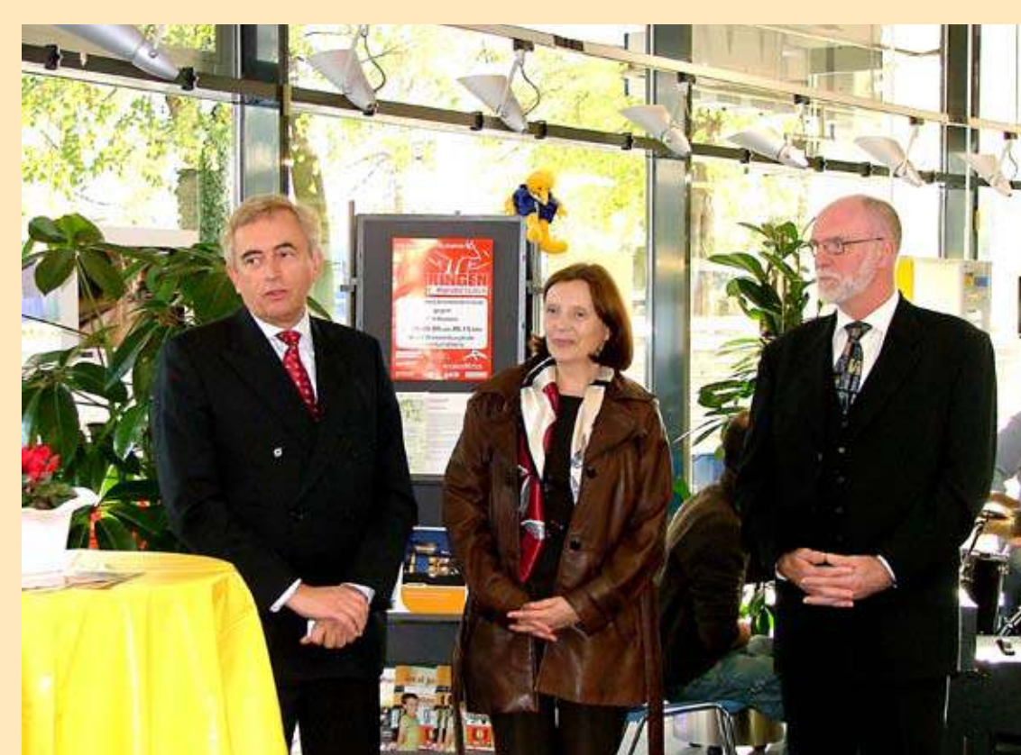
„Lange Nacht der Wirtschaft“

Seit 10 Jahren werden im Rahmen der Aktion „Die umweltfreundliche Schulmappe“ der Abfallberatung der Stadt und der Stadtwerke an alle Frankfurter ABC-Schützen zum Schulanfang Brotdosen und Stundenpläne mit Tipps für eine umweltfreundliche Schulmappe verteilt. Mit dieser Aktion wird den Kindern direkt zu Beginn des neuen Lebensabschnitts verdeutlicht, wie wichtig die Vermeidung von Abfall ist.