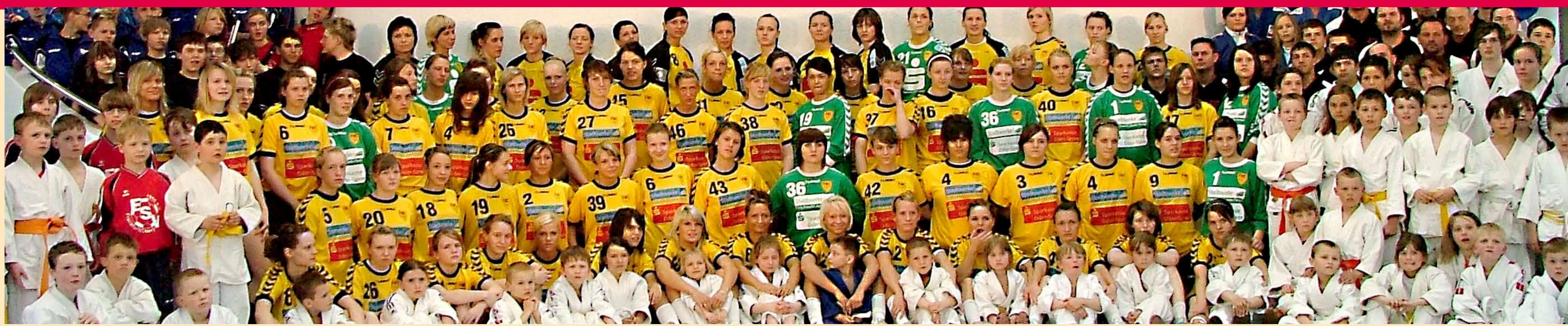
Sportlerförderung der Stadtwerke