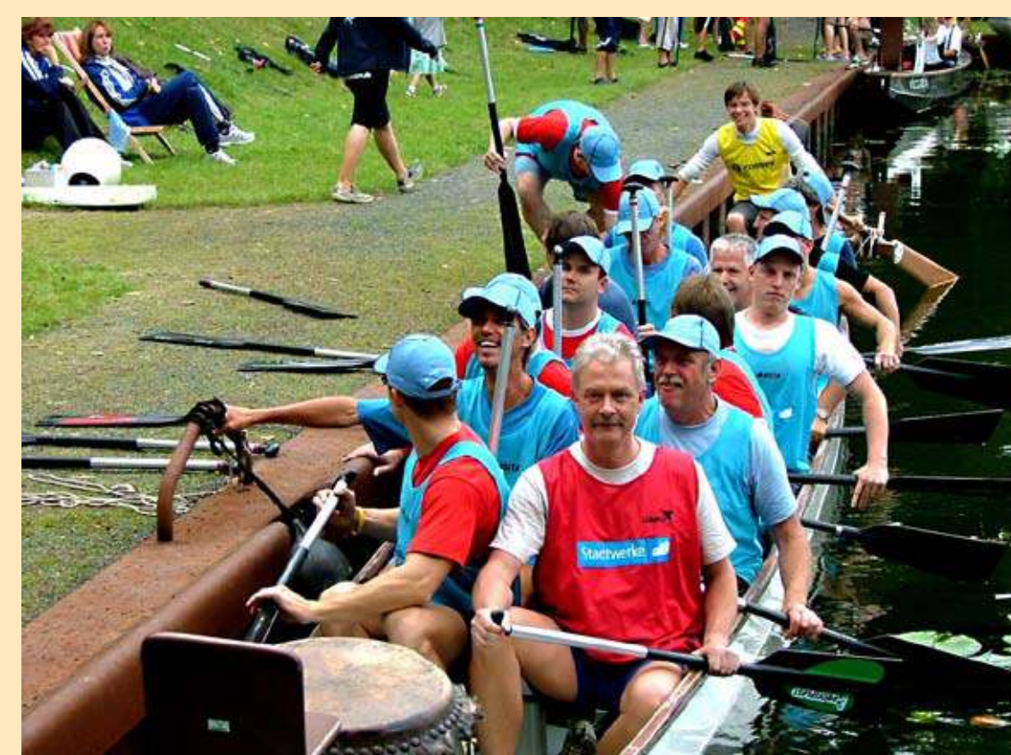
Drachenbootrennen auf der Spree

Hunderte Zuschauer wollten beim Hansestadtfest „Bunter Hering 2008“ die Zweitauflage des Wettbewerbs im Erdgasbusziehen sehen. Als Titelverteidiger gab die Mannschaft des SV Armwrestling, die im vergangenen Jahr den stärksten Mann Deutschlands geschlagen hatte, mit 14,90 s die erste Zeit vor. Diese Zeit sollte aber nicht zur Titelverteidigung reichen, denn zur Überraschung der Zuschauer waren die Basketballer des SV Preußen mit 13,62 s und die siegreichen Sportler des Frankfurter Box-Club mit 13,47 s schneller.