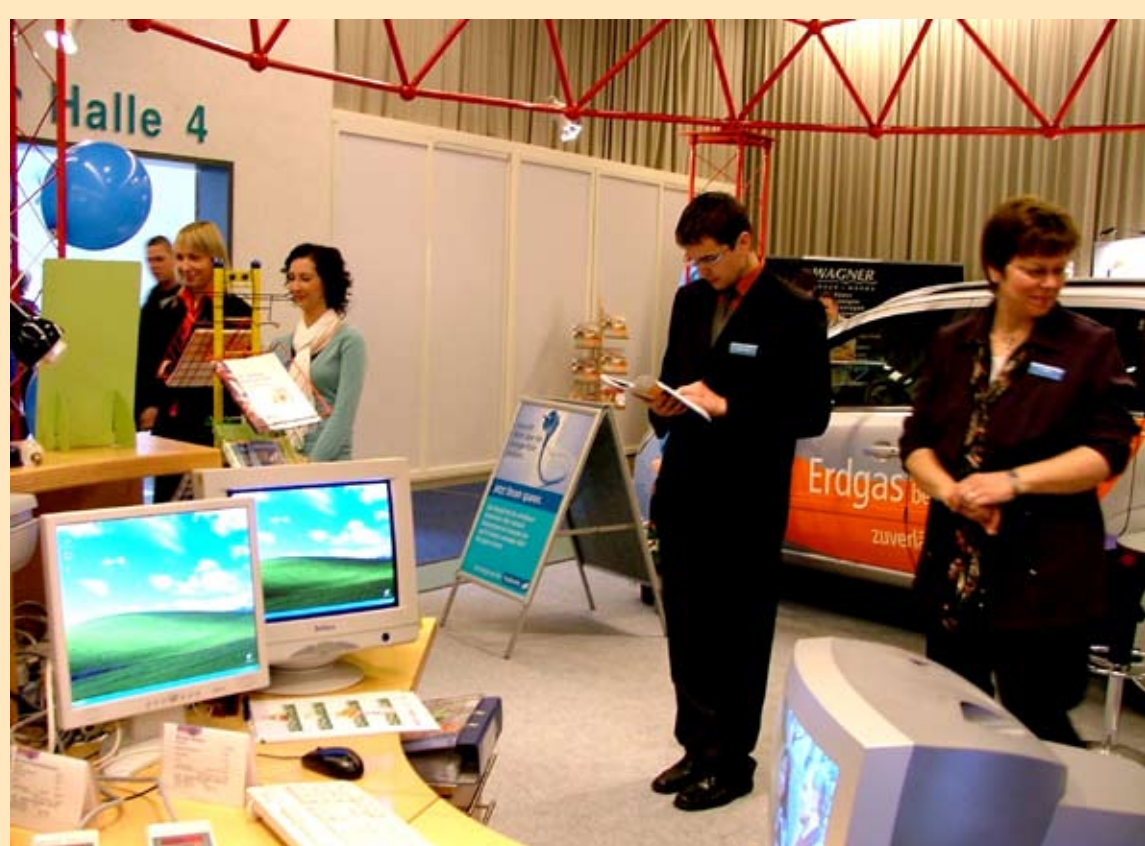
Messe BAUEN+ENERGIE 2008

Mit „Die Energie von hier“ präsentierten sich die Stadtwerke auf der Messe BAUEN+ENERGIE 2008. Dabei standen Energieeffizienz im Heimbüro und Umweltentlastung durch Fahrspaß mit Erdgas im Mittelpunkt des Informationsangebots.