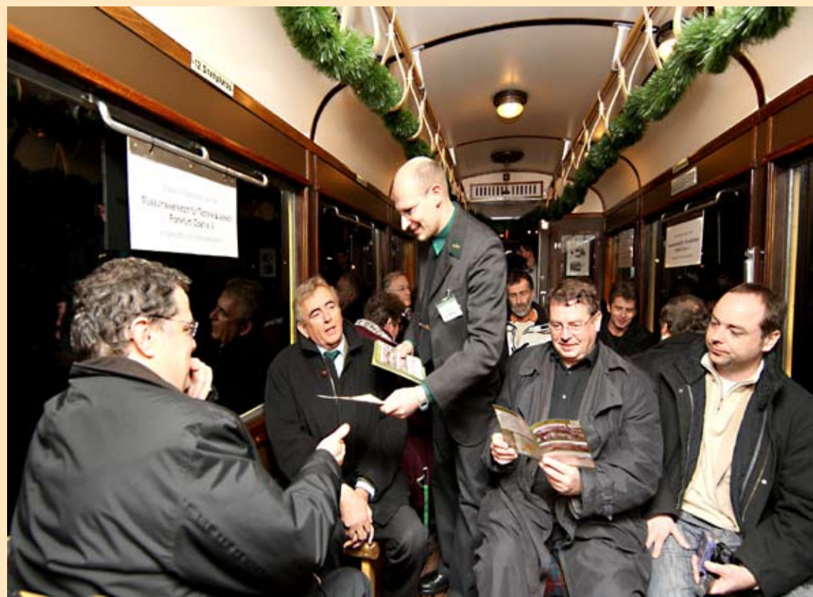
110 Jahre Strom und Straßenbahn