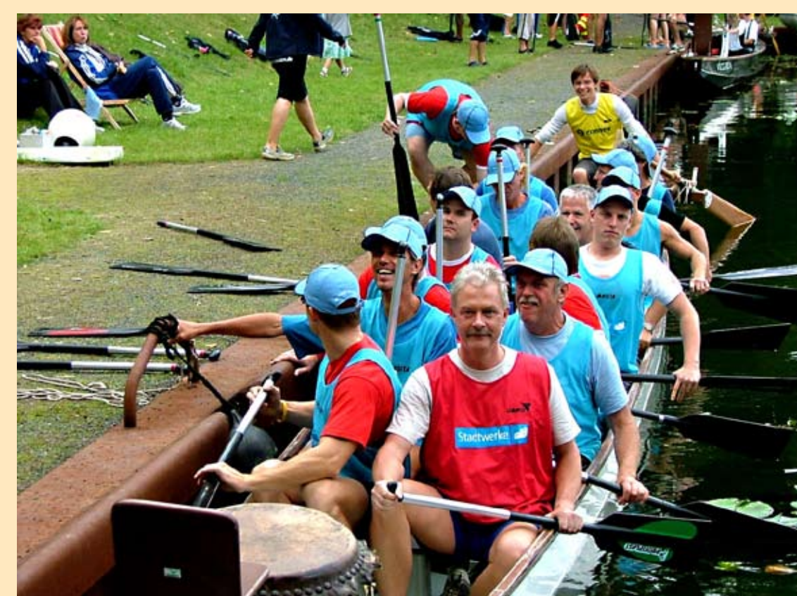
Drachenbootrennen auf der Spree

Hunderte Zuschauer wollten beim Hansestadtfest „Bunter Hering 2008“ die Zweitauflage des Wettbewerbs im Erdgasbusziehen sehen. Als Titelverteidiger gab die Mannschaft des SV Armwrestling, die im vergangenen Jahr den stärksten Mann Deutschlands geschlagen hatte, mit 14,90 s die erste Zeit vor. Diese Zeit sollte aber nicht zur Titelverteidigung reichen, denn zur Überraschung der Zuschauer waren die Basketballer des SV Preußen mit 13,62 s und die siegreichen Sportler des Frankfurter Box-Club mit 13,47 s schneller.