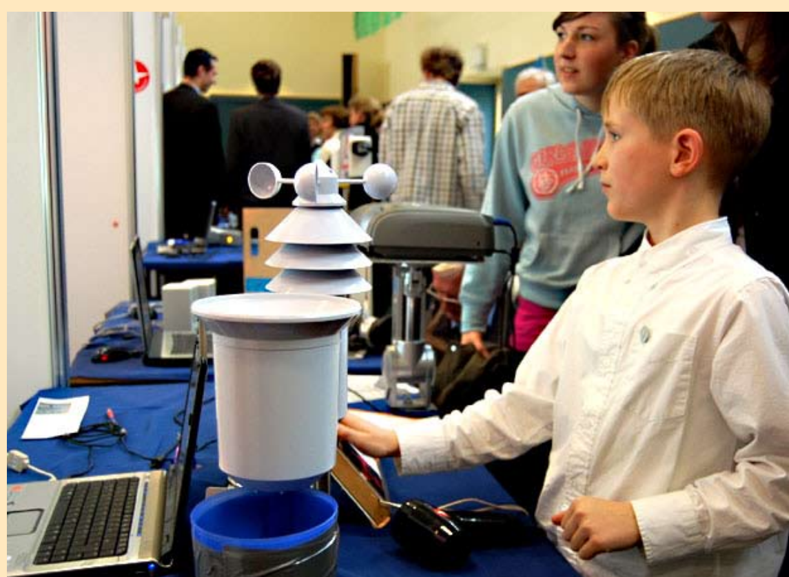
„Jugend forscht 2008“

In der Woche vom 19. bis 23. Mai 2008 fand in Brandenburg die 2. Erdgas-Rallye statt. Gesucht wurde die Fahrerin bzw. der Fahrer, der auf einer vorgegebenen Route den niedrigsten Kraftstoffverbrauch mit einem Erdgasfahrzeug erreichte. Am 23.5.08 war Frankfurt (Oder) Etappenziel. Aus diesem Anlass luden die Stadtwerke zu einem Erdgasauto-Treff an der Frankfurter Erdgastankstelle ein.