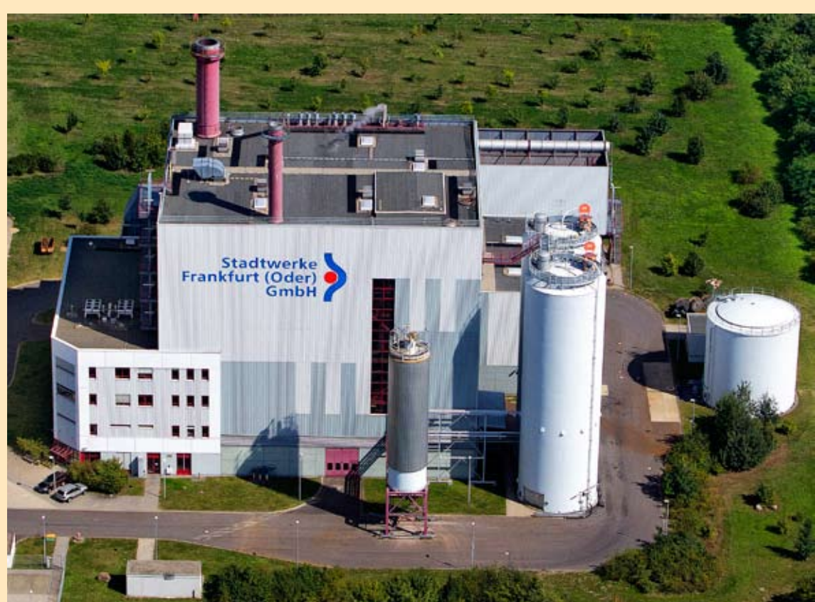
Das Heizkraftwerk Am Hohen Feld