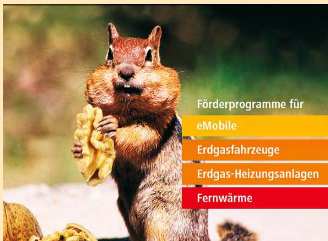
Das Bonus-Programm zum Klimaschutz