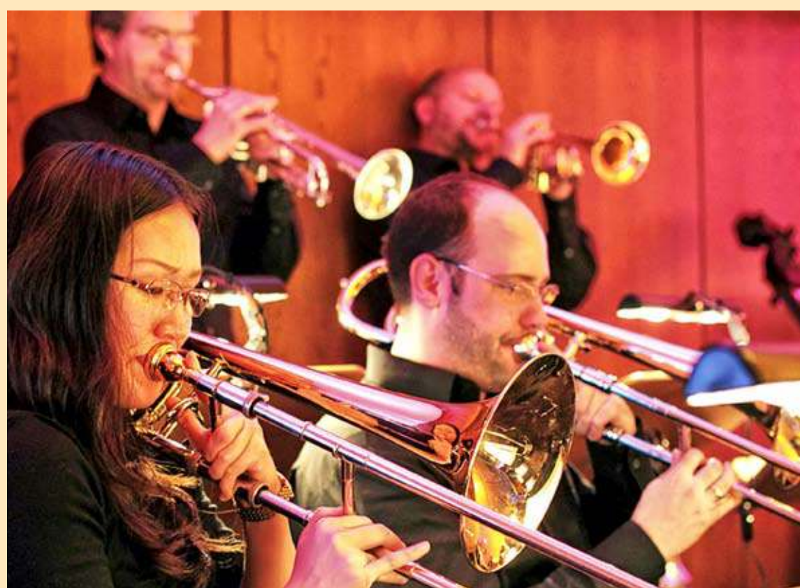
Die Bigband des BSO