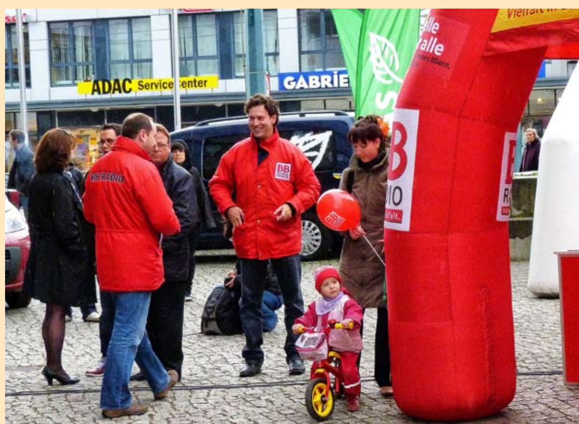
Die letzte Etappe der Erdgas-Rallye