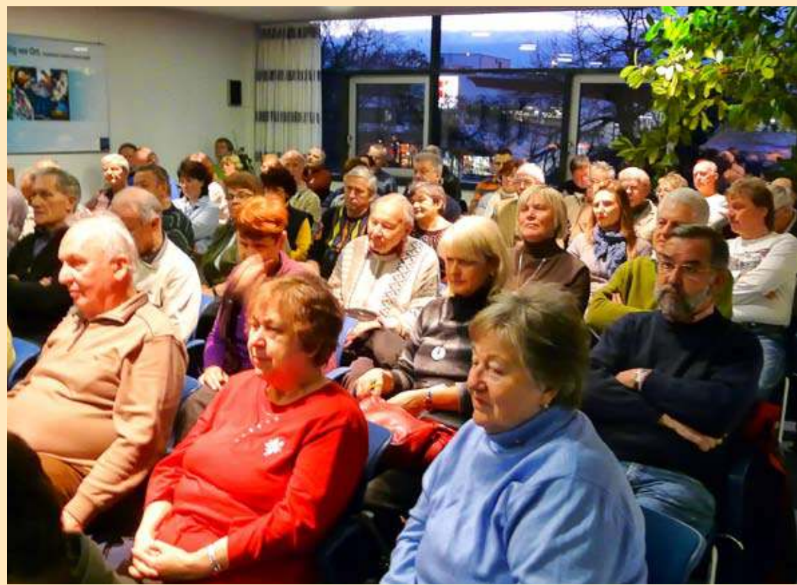
Interessiertes Publikum beim StadtwerkeForum