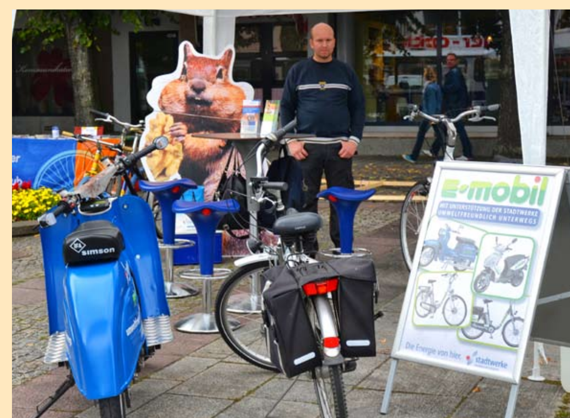
Die E-Bikes der Stadtwerke