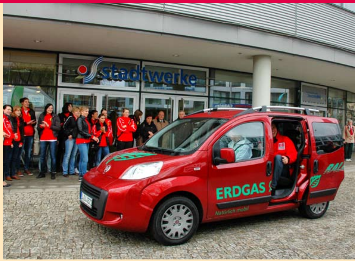
Zielankunft bei der Erdgas-Rallye im April