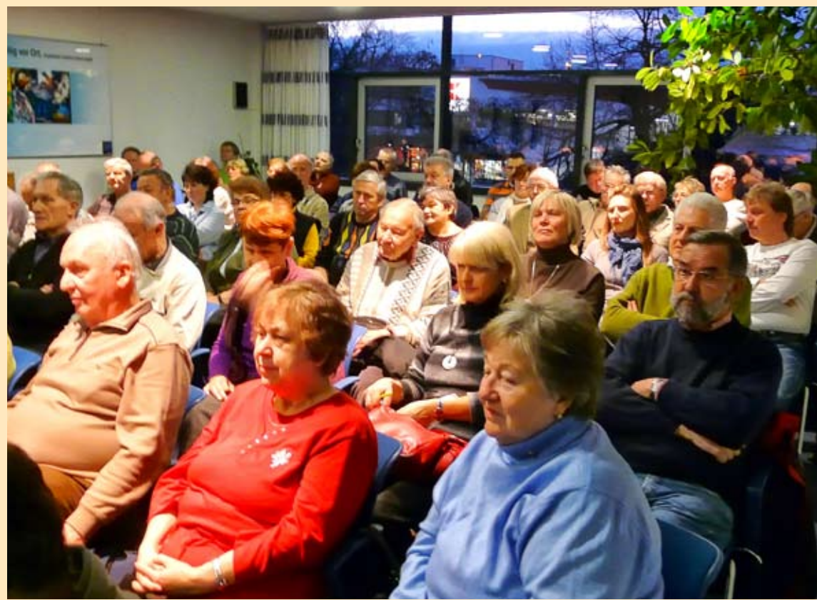
Interessiertes Publikum beim StadtwerkeForum