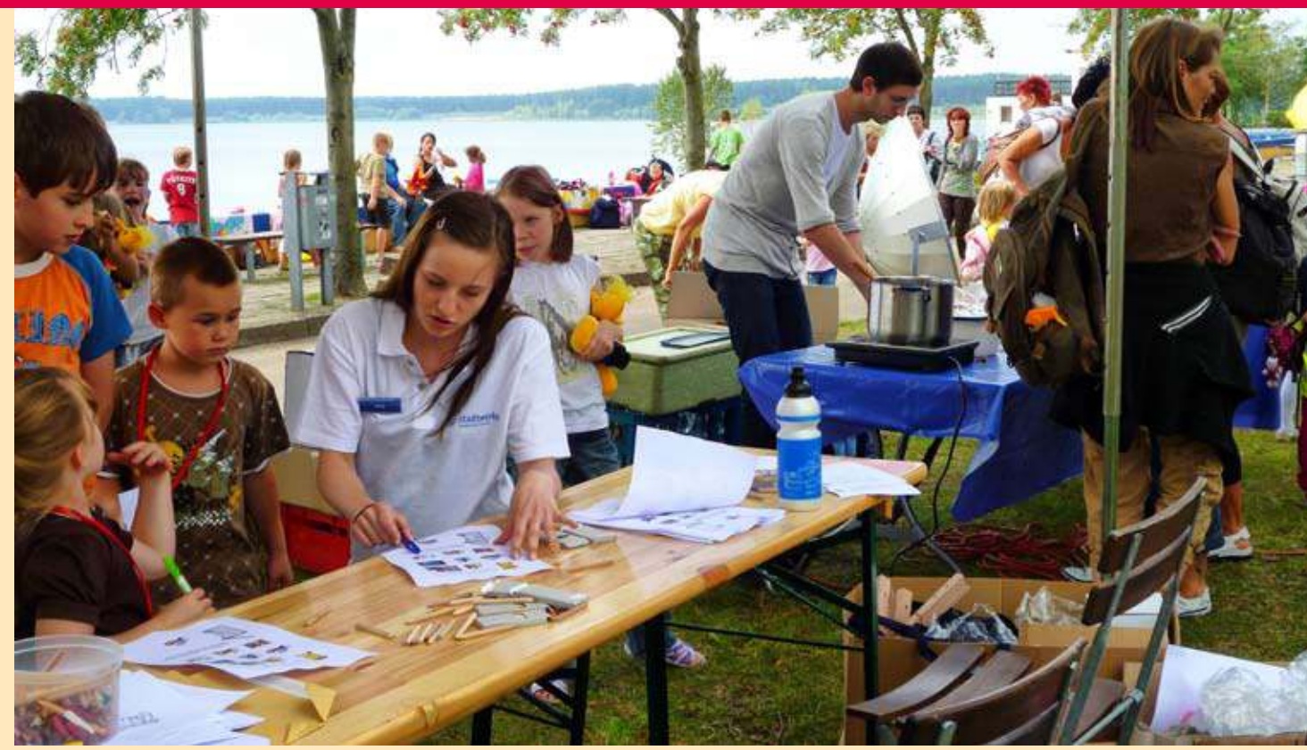
Umweltfest der Stadtwerke am Helensee im August