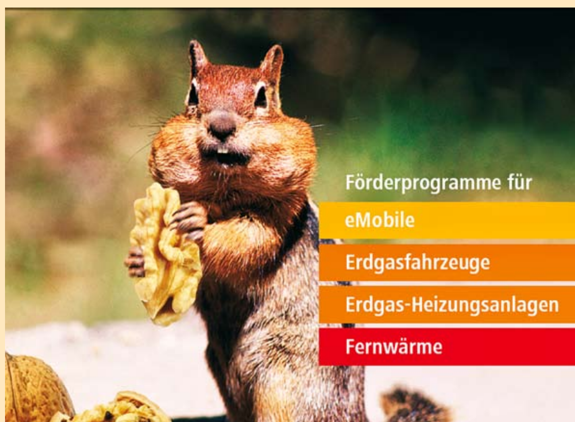
Das Bonus-Programm zum Klimaschutz