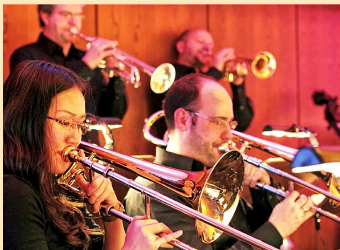
Die Bigband des BSO