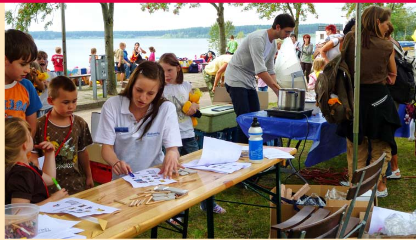
Umweltfest der Stadtwerke am Helensee im August