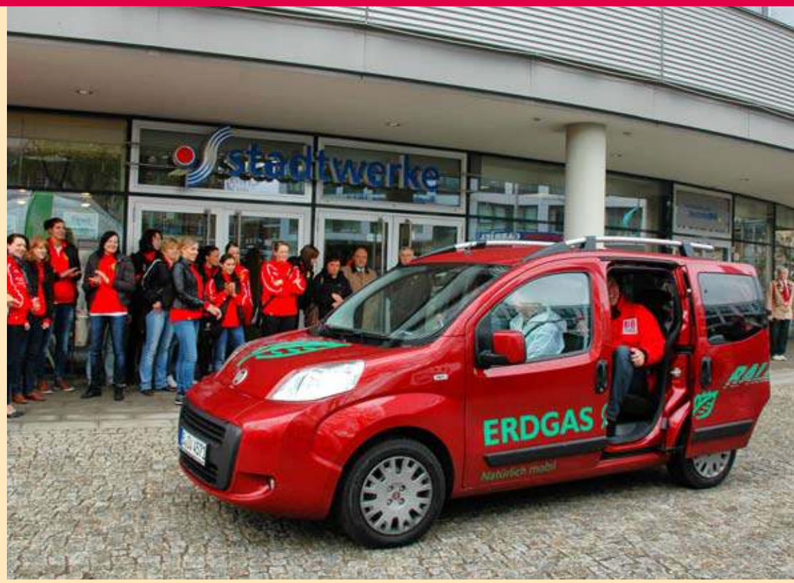
Zielankunft bei der Erdgas-Rallye im April