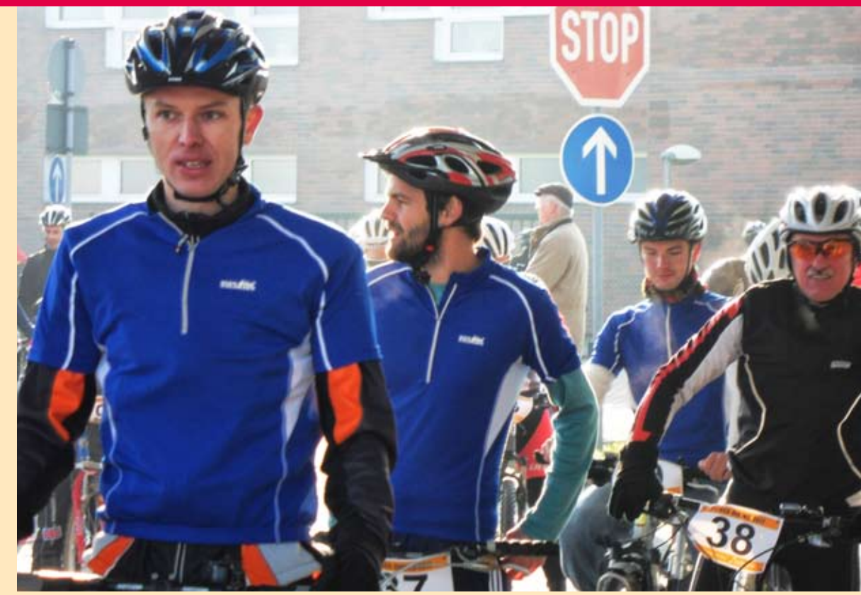
Traditionelles Powerbiking im Oktober