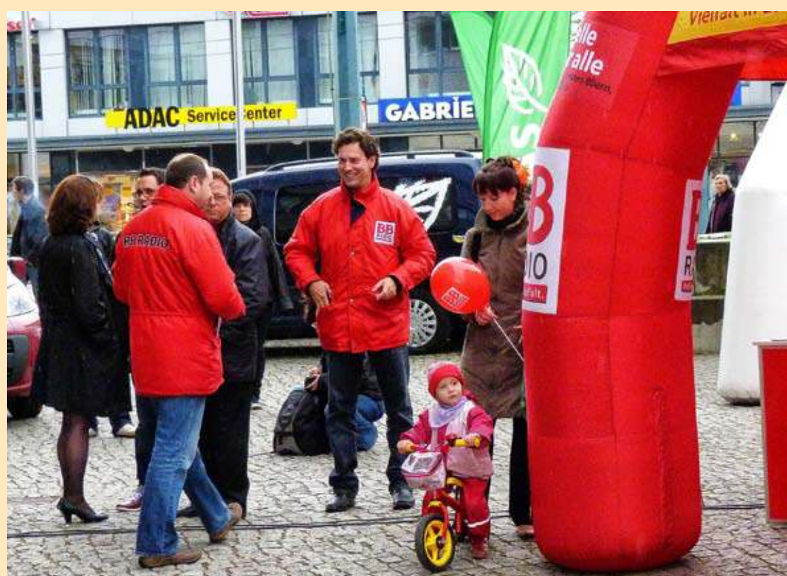
Die letzte Etappe der Erdgas-Rallye