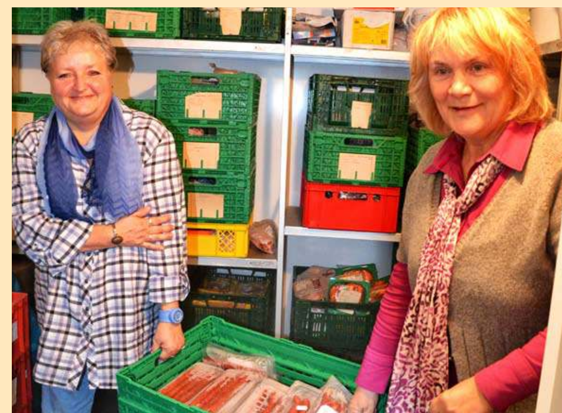
Unterstützung für die Arbeitsloseninitiative