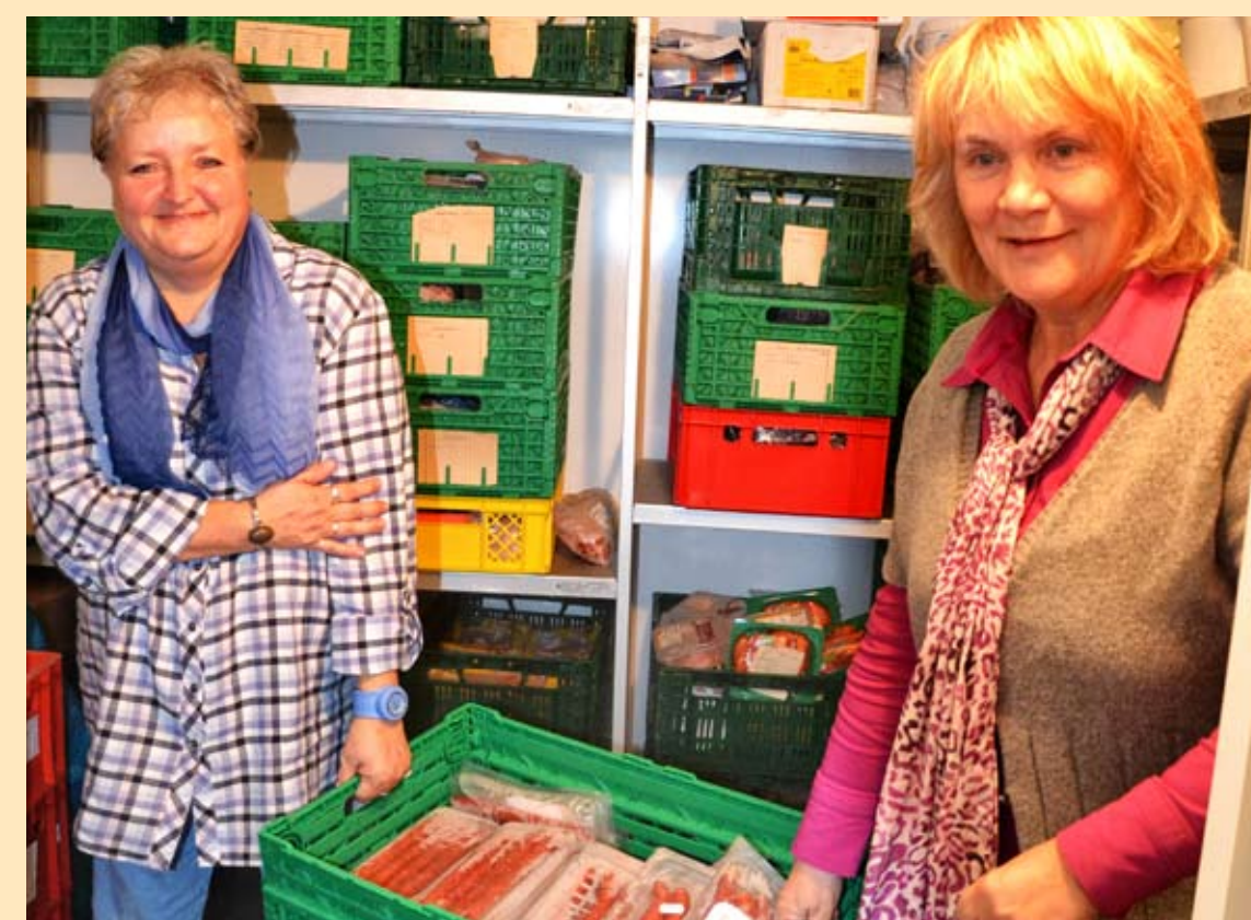
Unterstützung für die Arbeitsloseninitiative