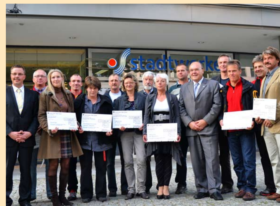
Von den Stadtwerken geförderte Vereine