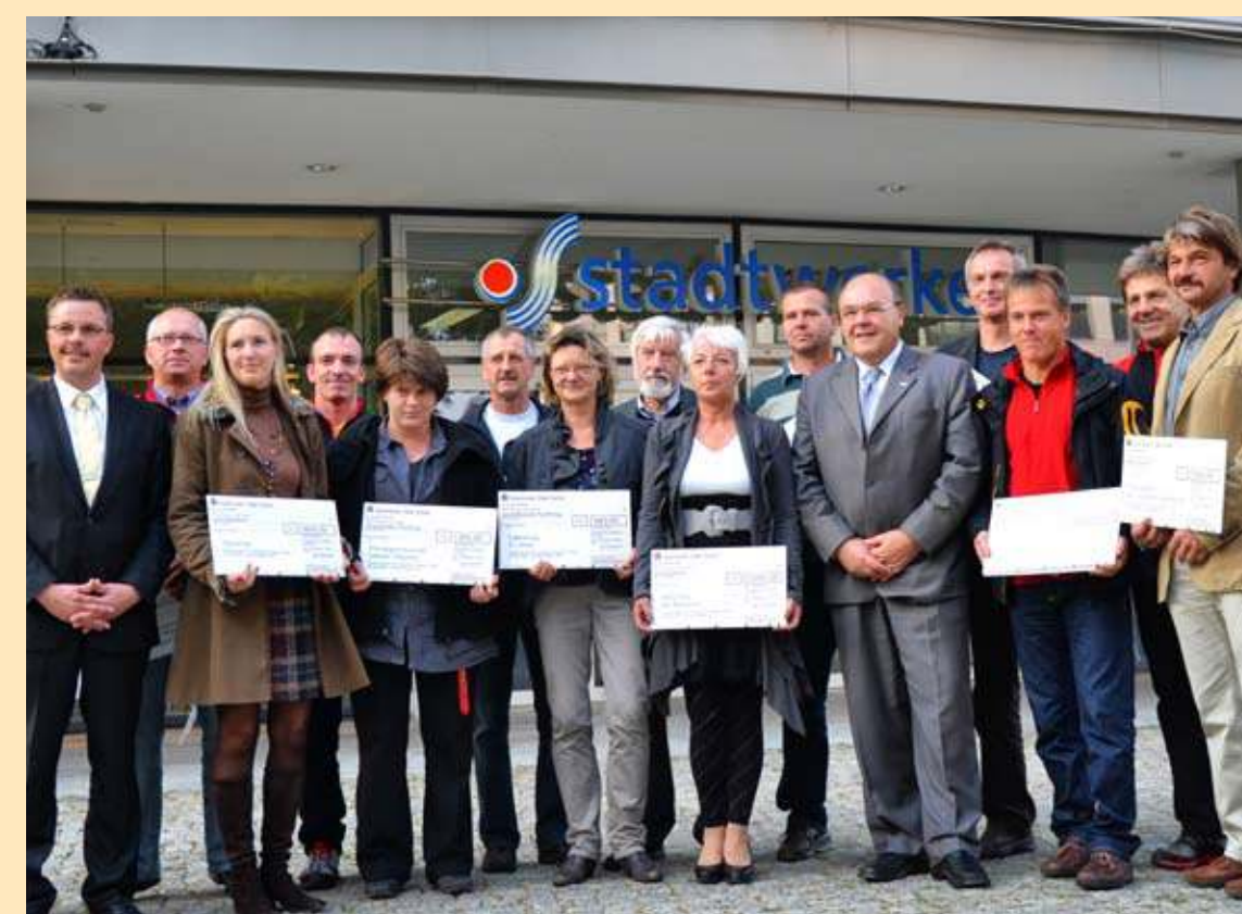
Von den Stadtwerken geförderte Vereine