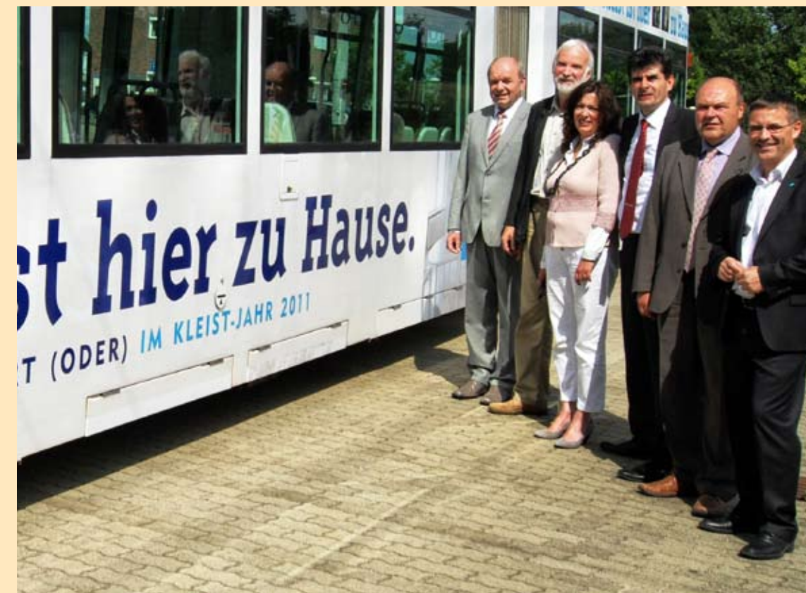
Übergabe der Kleist-Bahn im Juni