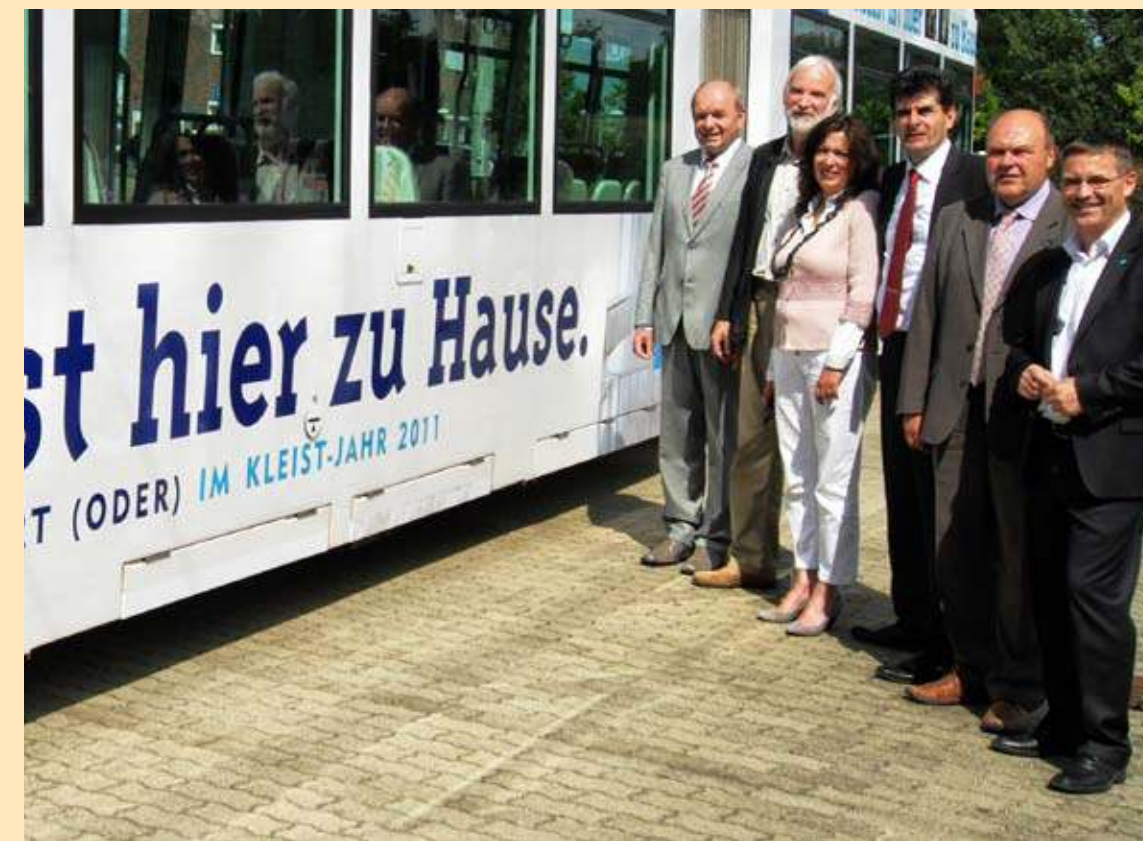
Übergabe der Kleist-Bahn im Juni