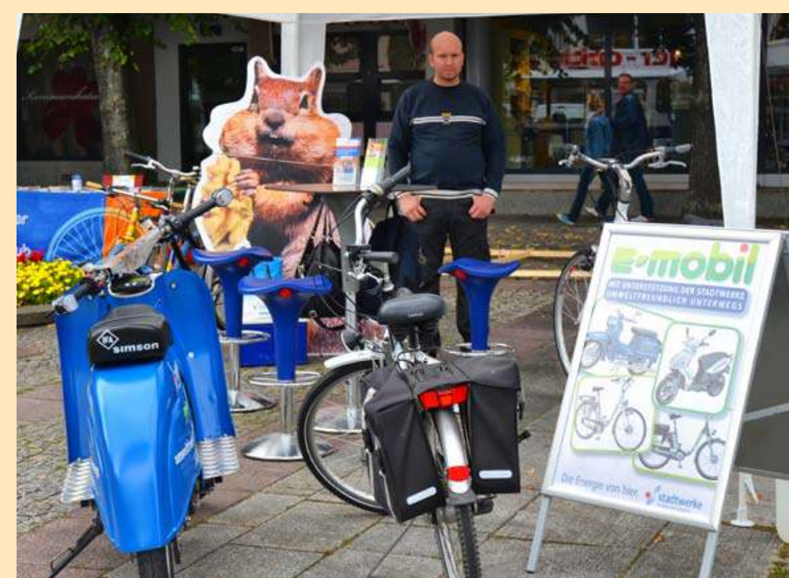
Die E-Bikes der Stadtwerke