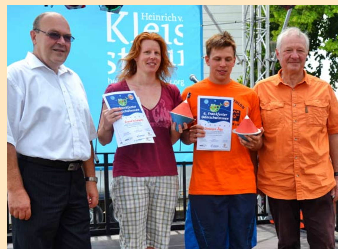
Die Sieger beim Oderschwimmen