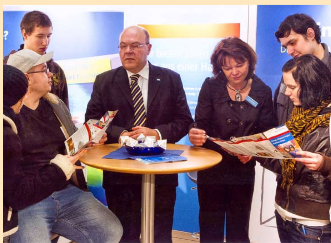
Auf der Messe BAUEN+ENERGIE

Ein Musikerlebnis voller Emotionen erwartete die Besucher des Kesselhauskonzertes. Die Bigband des Brandenburgischen Staatsorchesters heizte den Gästen mit feurigen Rhythmen und warmen Tönen ein.