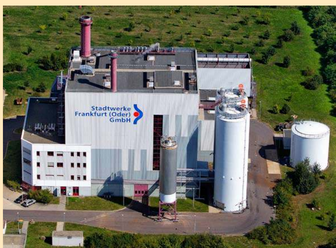
Das Heizkraftwerk Am Hohen Feld