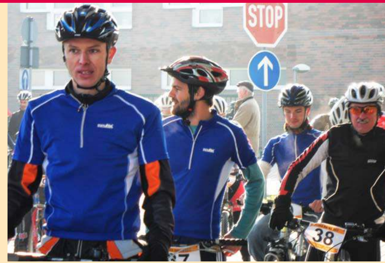
Traditionelles Powerbiking im Oktober